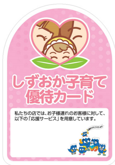
【ステッカー】のデザイン