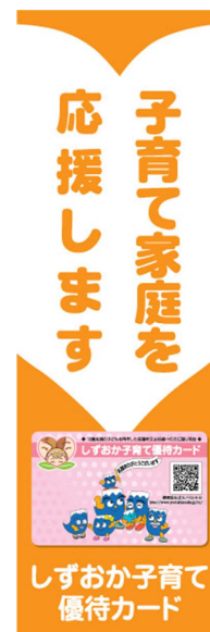
【ミニのぼり】のデザイン